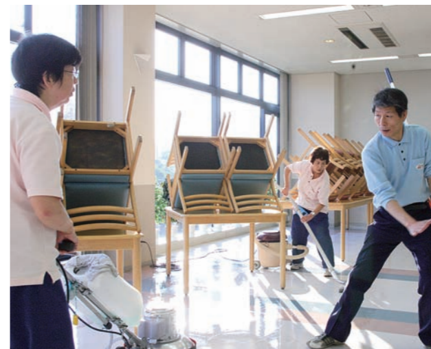
▲リーダーが的確に指示を出す。