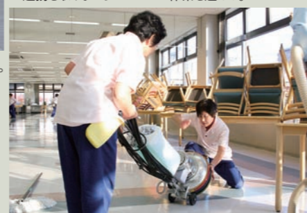
▲ポリッシャーを使っている作業。

当社の設立時より、聴覚障害者は主にグループで行う清掃業務を担当していた。しかし長年に亘り日常清掃のみを受託し、専門知識がないこともあって業務量が増えない状態が続いていた。そこで、これまで外部業者に委託していた定期清掃という新たな職域拡大を目指すこととなった。