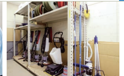
▲清掃道具置き場は整理整頓されている。