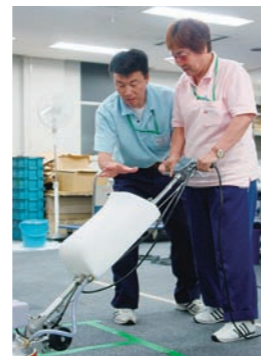
▲実際に機器を使って指導。

以上の取り組みの過程では、情報保障として、手話通訳を配置。必要な機器購入のための助成金も申請し、清掃グループ全体で定期清掃を実施できるようになった。