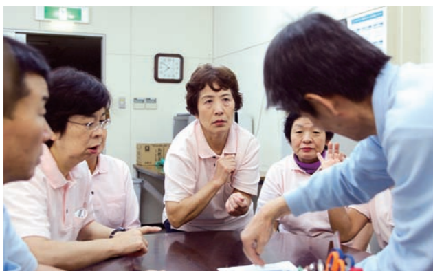
▲細かな打ち合わせを怠らない。

り返し、メンバー全員が細かな課題や情報を共有することができるようになった。その結果、一人ひとりが「今、何をすべきか」ということを自覚でき自主的に動くことができるようになることに加え、結束力も高まった。グループ全体のスキルアップにもつながり、社外から評価を得て売り上げにも貢献、さらに、従来行っていた日常清掃のレベルまで向上するという、相乗効果まで表れた。