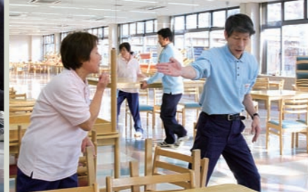
▲連携を取りながらスムーズに作業を進める。