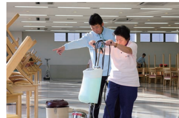
▲リーダーがメンバーに適宜指示をする。

しかし、業務を進めていく中で様々な問題も浮上してきた。定期清掃は短時間でいかにきれいにできるかがポイントで、そのためにはメンバー同士が声を掛け合い連携を取らなければならない。しかし、作業を進めながらの情報伝達が困難でメンバー間の連携がうまく取れておらず、無駄な動きも多く発生していた。そこで、事前に綿密な打ち合わせをし、また作業終了後には反省会を実施。そしてその反省会での内容を踏まえて事前打ち合わせを行い、作業に臨む…という手順を毎回繰り返していった。すると、準備段階からメンバーが情報を共有でき、作業の効率がアップ。同時に、これまで健聴者が行ってきた作業スケジュール表や道具準備表の作成も先行メンバーが徐々にできるようになるなど、清掃以外のスキルも向上した。グループには一体感が生まれ、作業時間も短縮。社外からの評価も高まり、会社の売上に貢献している。