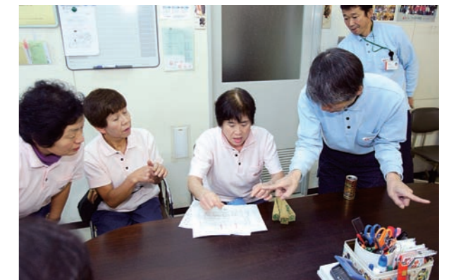
▲事前打ち合わせと反省会を実施。