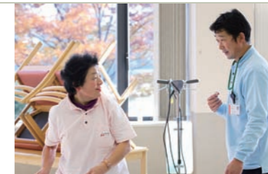
▲頻繁にコミュニケーションを取る。