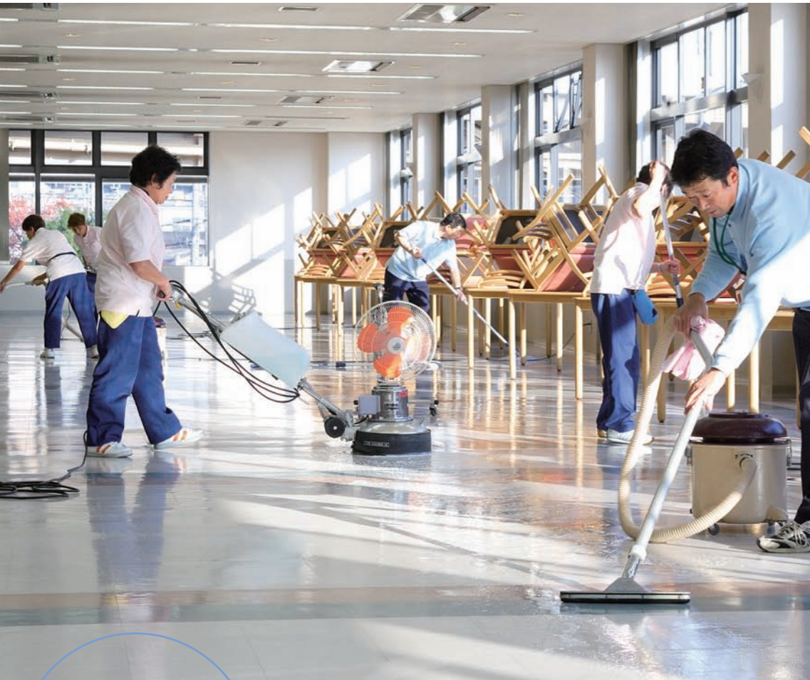
▲スタッフ全員、機敏に作業をしている。