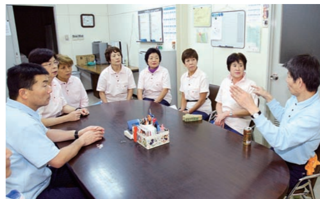
▲事前打ち合わせの様子。