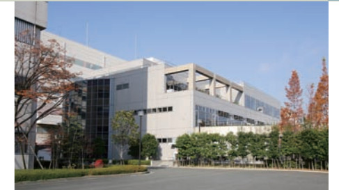
▲清掃を担当している食堂の外観。